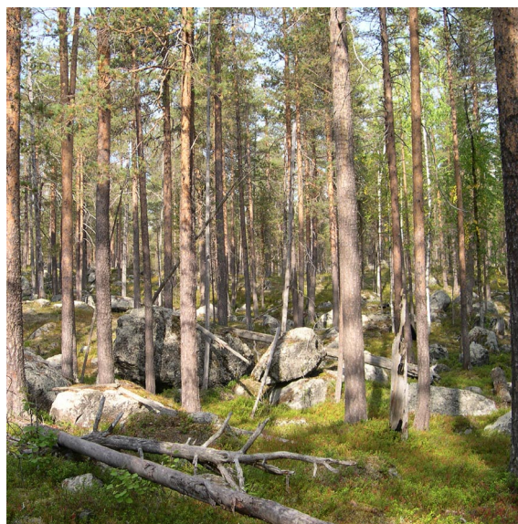
I Gardejaurlidens mest blockrika partier finns få spår av skogsbruk.

kritporing, rosenticka, violmussling, ullticka, talticka, rävticka, rynkskinn, korktaggsvamp, fjälltaggsvamp, goliatmusseron, spår av reliktböck samt orre och tjäder.