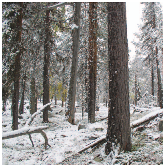
Gammal, flerskiktad tallskog med gott om grov, död ved karakteriserar området. Sydöstra delen av objektet.

torrakor ett brandljud. Tallskogen är svagt till måttligt påverkad av dimensionsavverkning med yxa för ungefär 100 år sedan. Toppreionen dimensionsavverkades i överlag efter grova torrträdd medan man i de lägre delarna även avverkade timmerstockar i måttlig mängd.