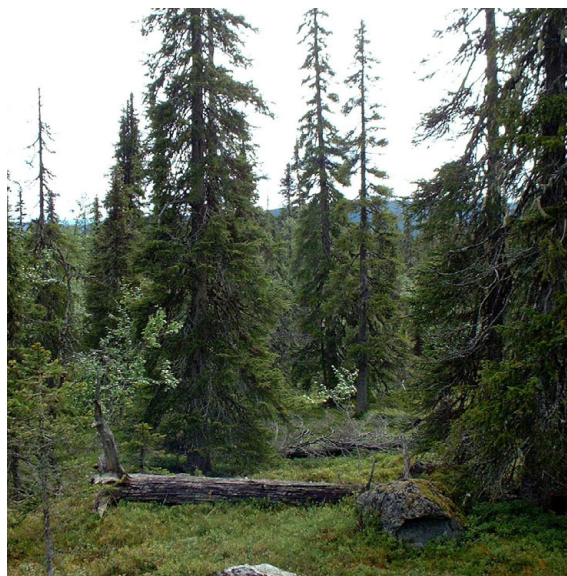
Typisk, gles granurskog i södra delen av området.

är låg runt Alep Tjeutjenåive. Vid inventeringen återfanns fåtal stubbar efter grova tallar eller torrfuror, troligen från småskaligt lokalt utnyttjande.