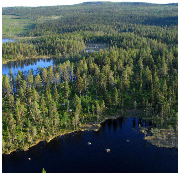
Området gränisar till Ståkke-Bårgå naturreservat. Gränsen för reservatet går i kalhyggets övre kant.

öar av gammal urskogsartad tallskog. Blockdeltat består i ett fullkomligt sterilt och långsträckt klapperstensliknande område men med övervägande mindre stenar än kustområdets klapperstensfält. Blockdeltat är plant med låga, terrassliknande avsatser och helt fritt från vegetation.