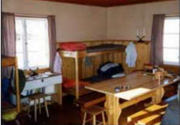
Stora rummet med matbord och 4 sängplatser.

Städmaterial och rengöringsmedel finns i stugan.