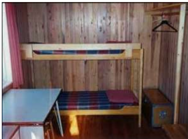
Lilla rummet, med två sängplatser.