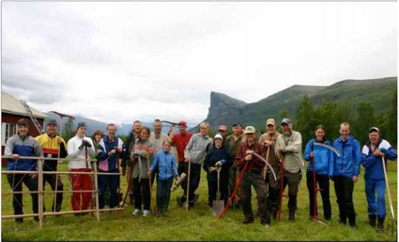
Slätter i Aktse.

Bokning är inte möjlig under slätterveckan, vecka 31. Avbokning: kan ske upp till 30 dagar innan hyrestillfället, en avbokningsavgift på 400 kr dras av på inbetalt hyresbelopp. Vid akut sjukdom etc. medges avbokning fram till dagen innan. Hyran faktureras i god tid innan hyrestillfället och ska vara betald innan man åker till Aktse.