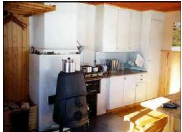
Köket i stora rummet.