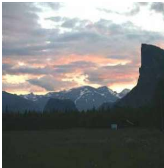
Skierfe, vaktposten in till Rapadalen. Nammatji bakgrunden.

Du kommer till Aktse med bil/taxi till Sitoälvsbron, en mils promenad och sedan båtskjuts över Laidaure, eller efter vandring längs Kungsleden från Saltoluokta eller Kvikkjokk.