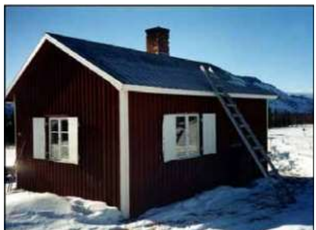
Stugan utifrån, vårvinter.