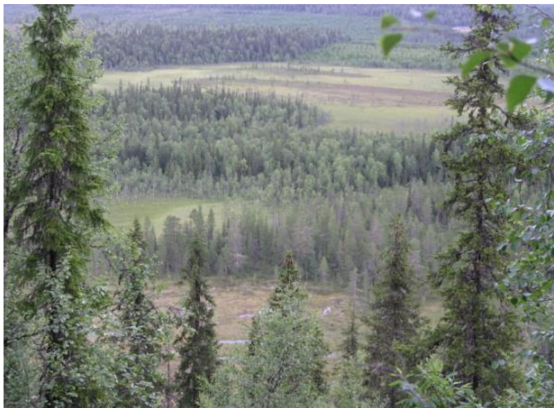
Skogsvy från Rautiorova.

Naturskyddsföreningarna i länet har lagt an moteld och skrivit till flera kommuner för att visa på en rad brister i deklarationen. Ett visst positivt resultat har kunnat uppnås då Luleå och Jokkmokk beslutat att inte skriva på.