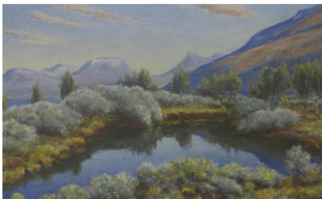
Oljemålning av Karl Tirén