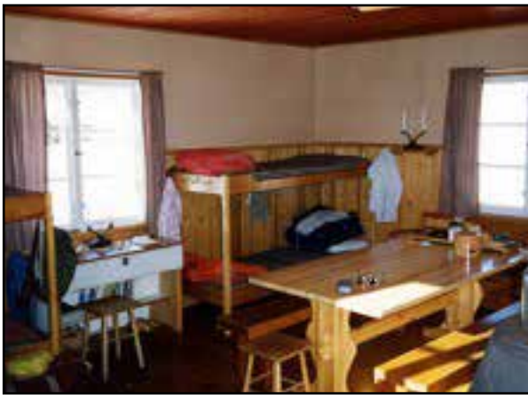
Stora rummet med matbord och 4 sängplatser.

Fakturan utgör bekräftelse på bokningen. Nyck-