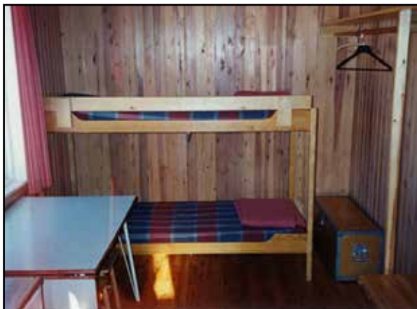
Lilla rummet, med två sängplatser.