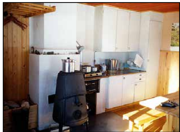
Köket i stora rummet.