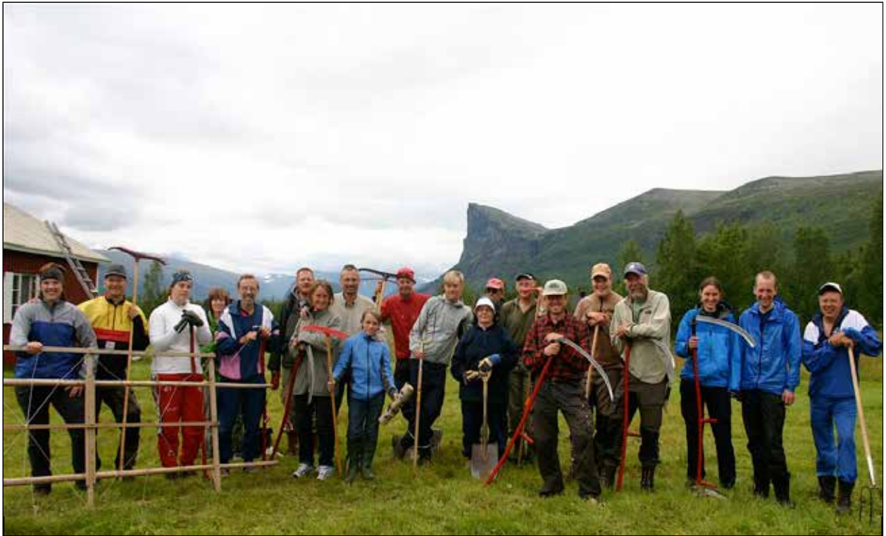
Slätter i Aktse.

eln hämtar du hos stugvärderna i Aktse. Bokning är inte möjlig under slätterveckan, vecka 32.