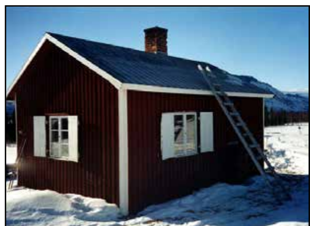
Stugan utifrån, vårvinter.